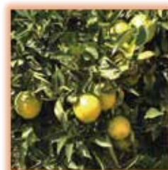
Clementgros Plus modalidade B