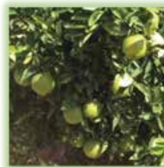
Clementgros Plus modalidade A